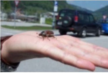
nik7.jpg (37.3 kB)