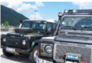
nik5.jpg (74.18 kB)