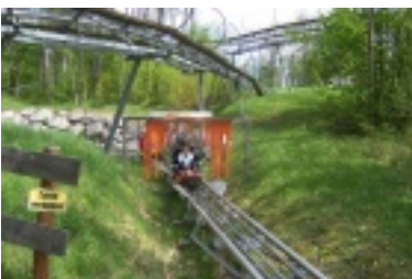
nik11.jpg (97.39 kB)

http://www.landy-club.de/index.php?cid=10&pdfview=1&section=gallery