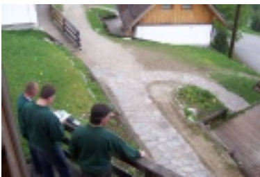
nik3.jpg (70.33 kB)