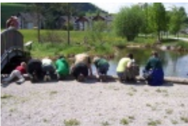
nik10.jpg (92.02 kB)