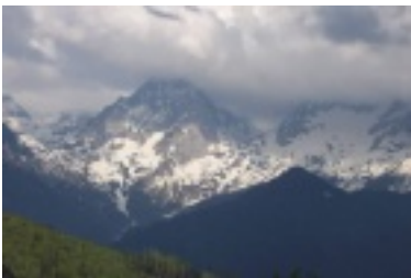
nik2.jpg (37.69 kB)