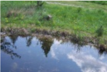
nik8.jpg (80.43 kB)