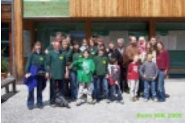
nik1.jpg (72.43 kB)

Sie sind hier: Bildergalerie / Landy-Club 2009 / Beim NIK