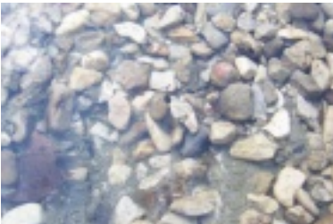
nik9.jpg (67.1 kB)