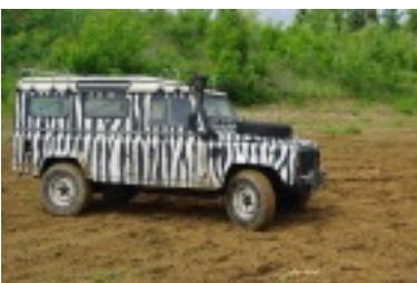
ald14.jpg (90.71 kB)