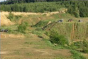
ald9.jpg (71.65 kB)