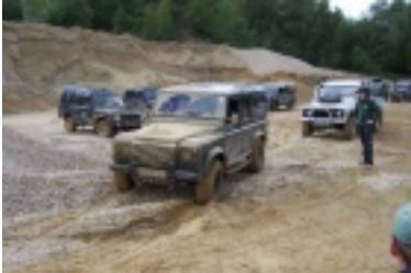
ald1.jpg (77.22 kB)

Sie sind hier: Bildergalerie / Landy-Club 2009 / Aldersbach Mai