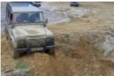
ald2.jpg (77.1 kB)