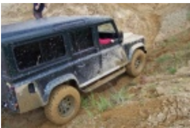
ald3.jpg (85.97 kB)