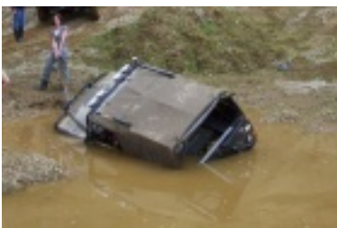
ald7.jpg (63.54 kB)