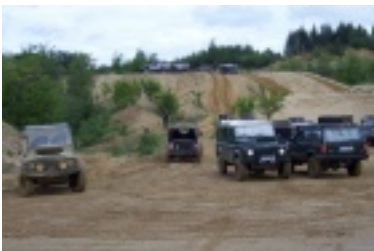
ald6.jpg (61.46 kB)