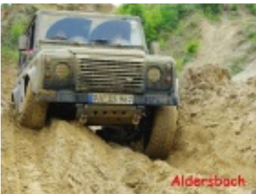
ald13.jpg (74.81 kB)