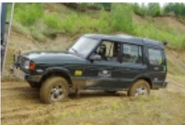
ald12.jpg (83.28 kB)