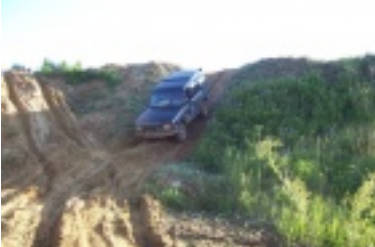
ald10.jpg (72.35 kB)