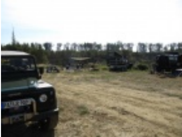
img_0695.jpg (61.35 kB)

Sie sind hier: Bildergalerie / Landy-Club 2009 / Aldersbach Oktober