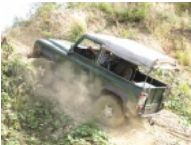
img_0698.jpg (96.04 kB)