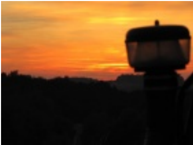
img_0722.jpg (24.87 kB)