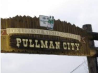
img_0739.jpg (43.04 kB)

Sie sind hier: Bildergalerie / Landy-Club 2009 / Pullman City Weihnachtsmarkt