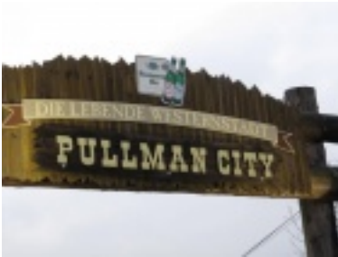
img_07391.jpg (43.04 kB)