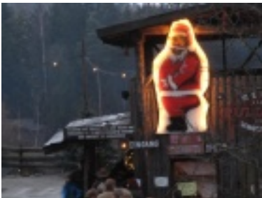
img_07401.jpg (53.03 kB)