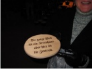
img_0749.jpg (28.13 kB)