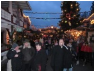
img_0743.jpg (66.58 kB)