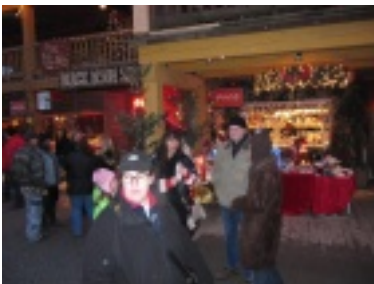
img_0742.jpg (67.32 kB)