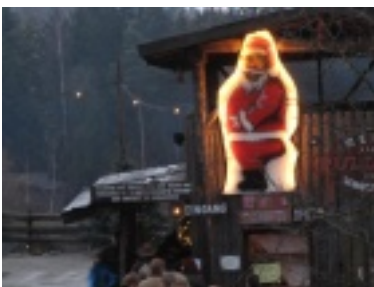
img_0740.jpg (53.03 kB)