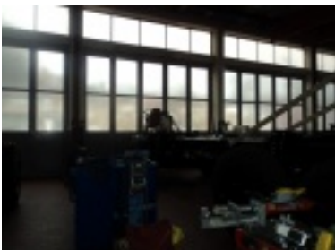
02.jpg (62.19 kB)