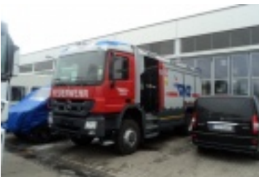
09.jpg (81.43 kB)