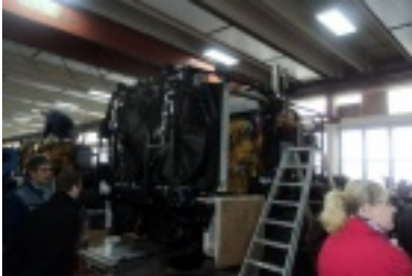
00.jpg (80.29 kB)

Sie sind hier: Bildergalerie / Landy-Club 2012 / Besichtigung Nutzfahrzeuge Paul