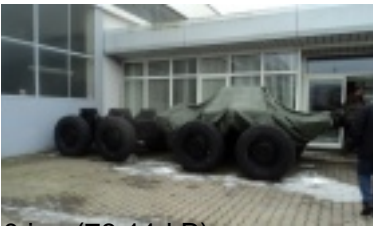
10.jpg (78.11 kB)