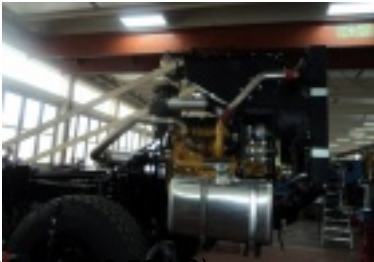
01.jpg (80.59 kB)