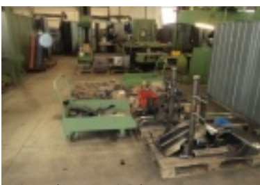
03.jpg (86.24 kB)