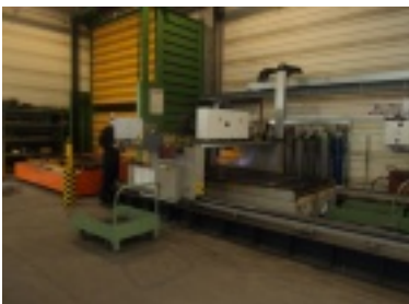
04.jpg (76.96 kB)