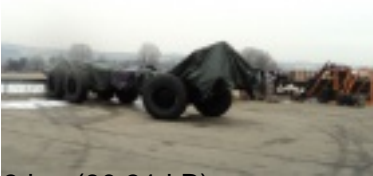
08.jpg (90.31 kB)