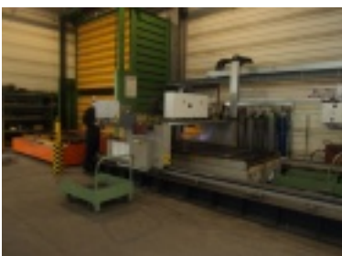
04.jpg (76.96 kB)