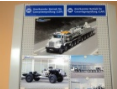
11.jpg (94.06 kB)