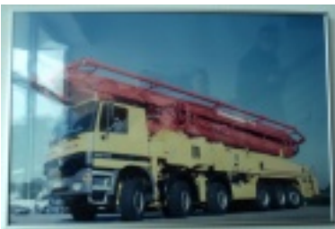
12.jpg (64.95 kB)