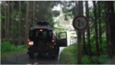
14.jpg (49.5 kB)