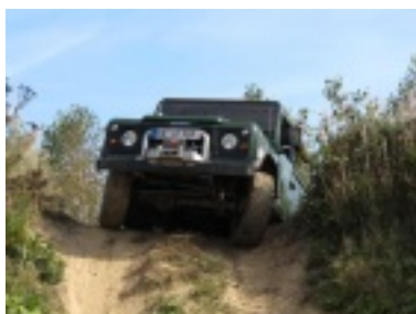
img_0700.jpg (70.73 kB)