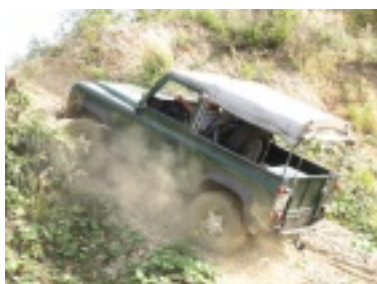
img_0698.jpg (96.04 kB)