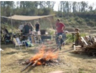
img_0713.jpg (96.02 kB)