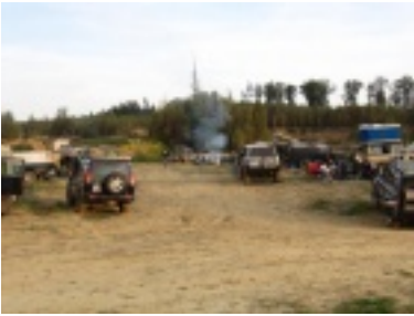
img_0720.jpg (59.44 kB)