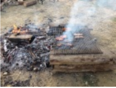
img_0719.jpg (92.47 kB)