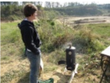
img_0714.jpg (103.66 kB)