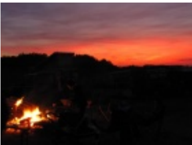
img_0726.jpg (28.48 kB)