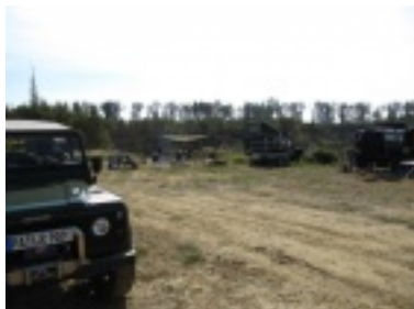
img_0695.jpg (61.35 kB)

Sie sind hier: Bildergalerie / Landy-Club 2009 / Aldersbach Oktober