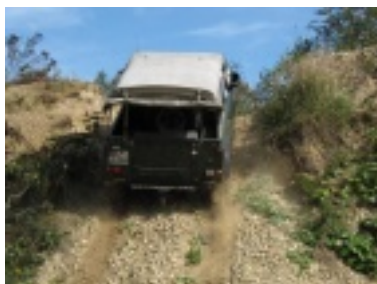
img_0699.jpg (84.64 kB)