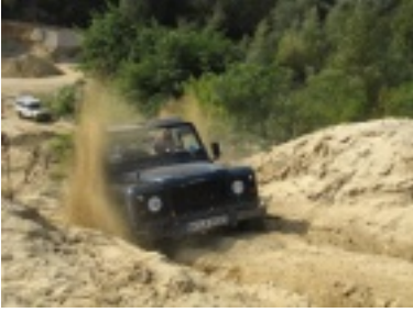
img_0708.jpg (84.09 kB)