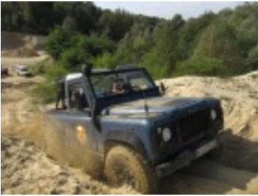
img_0709.jpg (78.92 kB)