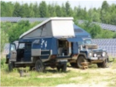
img_1073.jpg (109.14 kB)