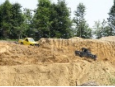
img_1078.jpg (125.31 kB)