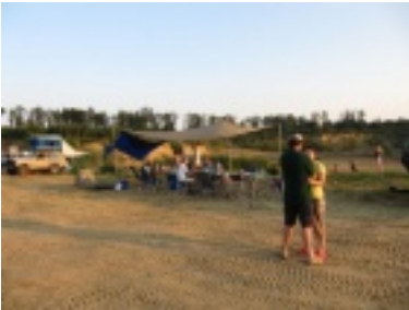
img_1087.jpg (74.1 kB)