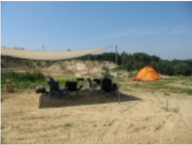
img_1072.jpg (73.1 kB)