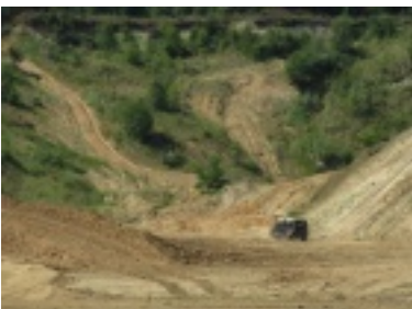
img_1075.jpg (95.5 kB)