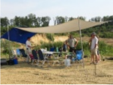
img_1086.jpg (96.88 kB)