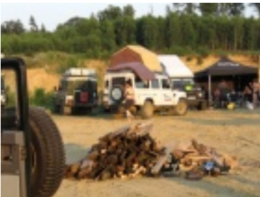
img_1088.jpg (99.6 kB)