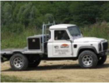
img_1081.jpg (87.26 kB)