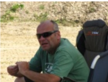
img_1074.jpg (72.86 kB)