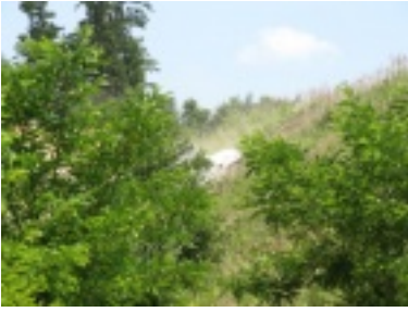
img_1084.jpg (119.65 kB)