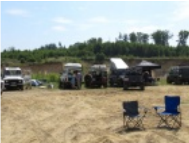
img_1080.jpg (80.53 kB)