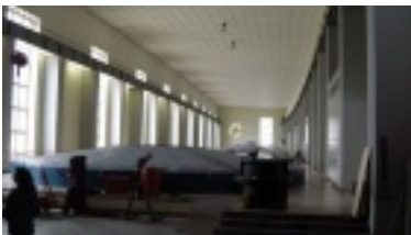
4.jpg (37.24 kB)