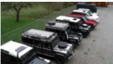
2.jpg (61.06 kB)