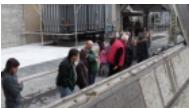
6.jpg (54.92 kB)